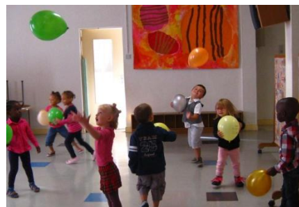
Lancer le ballon

Ces années sont très importantes car elles préparent votre enfant à l'école élémentaire par l'acquisition de gestes précis et par de véritables apprentissages.