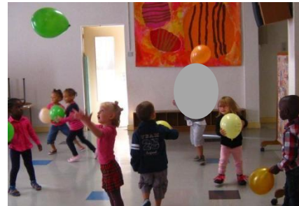
Lancer le ballon

Ces années sont très importantes car elles préparent votre enfant à l'école élémentaire par l'acquisition de gestes précis et par de véritables apprentissages.