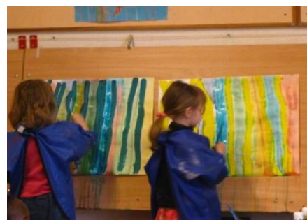
Peindre, tracer des lignes