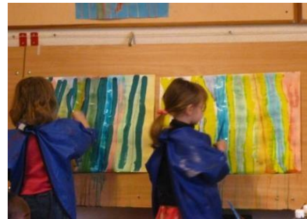
Peindre, tracer des lignes