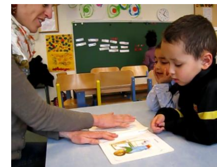
Apprendre à parler