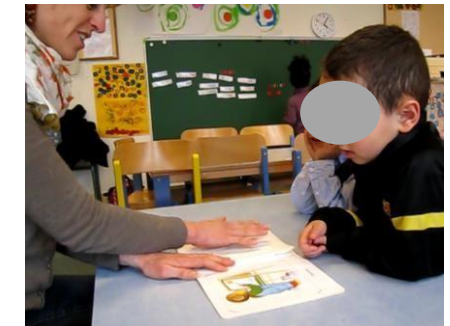
Apprendre à parler